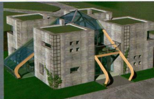
Budynek zaprojektowany zgodnie z dewizą „My home is my castle”. Wnętrza prywatne zamknięte są pełnymi ścianami. W ogólnych architekturze przewidział duże przeszklenia