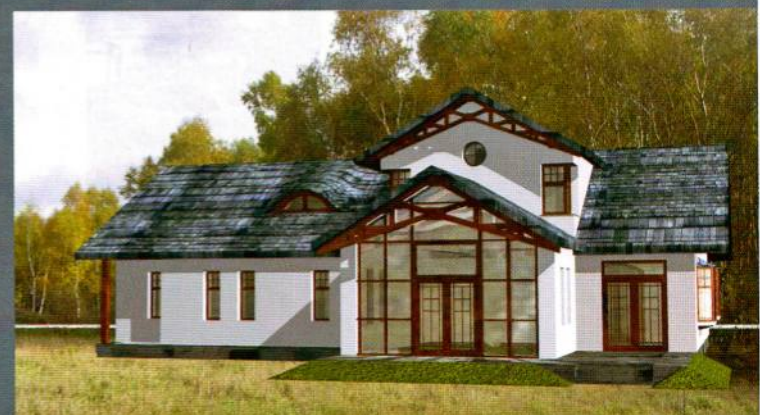
Projekt domu w Komorowie. Nawiązanie do stylu architektury podwarszawskich uzdrowisk. Budynek jest w trakcie budowy