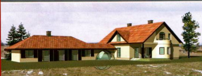
Projekt domu w Łowiczu. Budynek typowy dla regionu Mazowsza. Połączenie tradycyjnej architektury wiejskiej i dworkowej