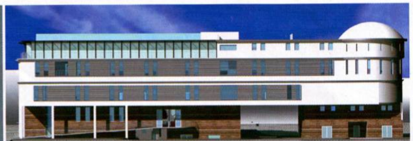
Projekt modernizacji szpitala Świętej Zofii w Warszawie. Grand Prix w piątej edycji konkursu o Nagrodę Architektoniczną im. Małgorzaty Baczko i Piotra Zakrzewskiego. „To udana propozycja połączenia architektury historycznej z początku XX w. ze współczesną, modernistyczną rozbudową” – uznali jurorzy

„Funkcjonalny dom powinien być estetyczny, niepowtarzalny i ponadczasowy” – twierdzi Michał Grzymała-Kazłowski. W jego studiu powstają także projekty budynków przemysłowych, obiektów sportowych i szpitali. Również koncepcje modernizacji.