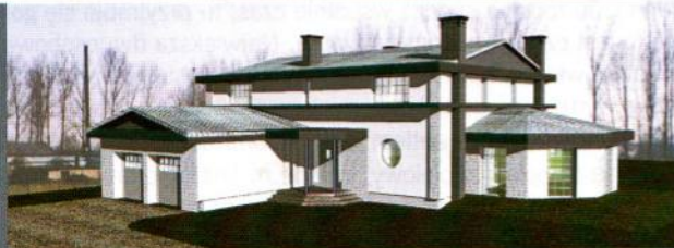
Dom jednorodzinny w Nieporęcie usytuowany na dużej płaskiej działce. Ukształtowanie terenu miało decydujący wpływ na formę budynku